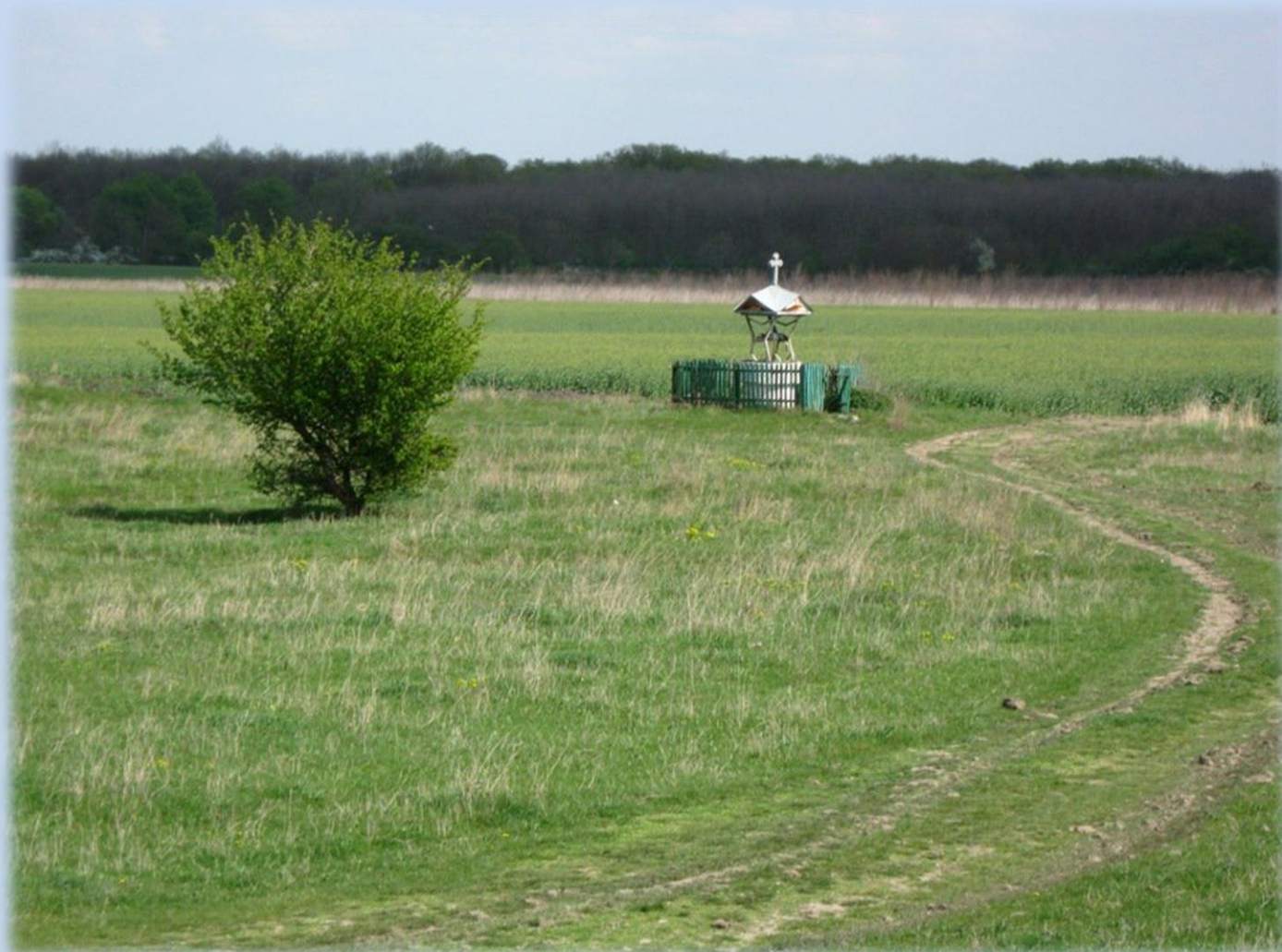
Lunca Prutului. Pădurea Domnească. Raionul Glodeni

Vizitați pagina ADR Nord din Facebook! Și aici, ADR Nord vorbește cu Dvs.