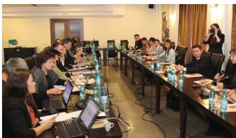
Atelier de lucru: MDRC-ADR-GIZ

CHIȘINĂU, 16 februarie. Ministerul Dezvoltării Regionale și Construcțiilor (MDRC), Agențiile de Dezvoltare Regională Nord, Centru și Sud împreună cu Agenția de Cooperare Internațională a Germaniei (GIZ) au discutat, în cadrul unui atelier de lucru, despre rolul, atribuțiile