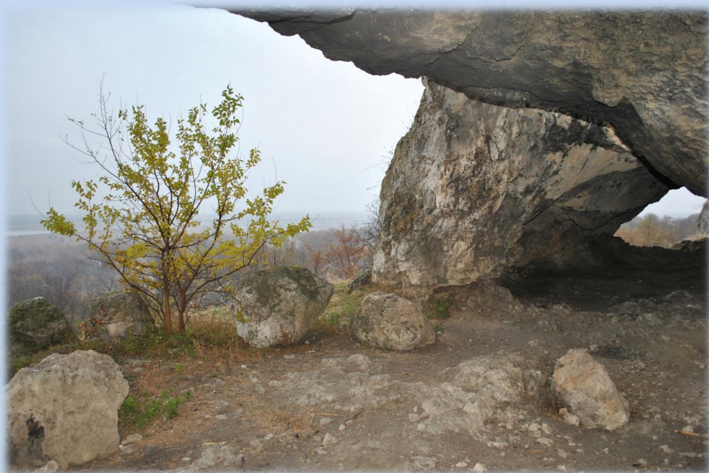
Duruitoarea Veche, raionul Rîșcani

Vizitați pagina ADR Nord din Facebook! Și aici, ADR Nord vorbește cu Dvs.