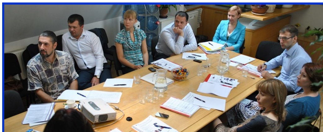
Sedință de lucru la Ministerul Protecției Mediului și Dezvoltării Regionale (VARAM)

L etonia, 27 iulie - 1 august 2013. Un grup de specialiști de la Agenția de Dezvoltare Regională Nord (ADR Nord) a efectuat o vizită de studiu în Letonia în vederea preluării experienței în domeniul elaborării documentelor strategice. Astfel, partenerii de dezvoltare din cadrul Ministerului Protecției Mediului și Dezvoltării Regionale (VARAM) din Letonia au oferit asistență specialiștilor ADR Nord în procesul de elaborare a Strategiei de Dezvoltare Socio-Economică a Regiunii de Dezvoltare Nord pentru perioada 2014-2020.